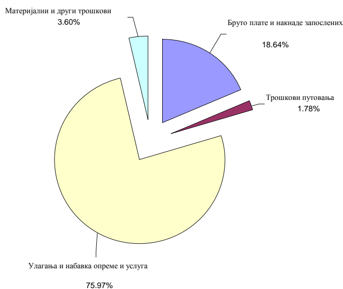
Графикон 2. Структура пројектованих трошкова примене Акционог плана по врстама у 2009. години, у процентима

Посматрано по изворима средстава, настојало се да буџет Акционог плана за 2009. годину буде тако структуриран имајући у виду следеће битне чињенице: